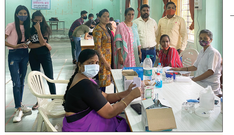
वसई येथील अण्णासाहेब वर्तक महाविद्यालयातील १५ ते १८ वयोगटातील विद्यार्थी-विद्यार्थिनींना कोरोना प्रतिबंधक लसीकरण सुरु आहे. महाविद्यालयाचे प्राध्यापकांच्या देखरेखीखाली वसई-विरार महापालिकेकडून ही लसीकरण मोहिम राबविली जात आहे. या मोहिमेला गेल्या तीन-चार दिवसांपासून उत्स्फूर्त असा प्रतिसाद मिळत आहे.